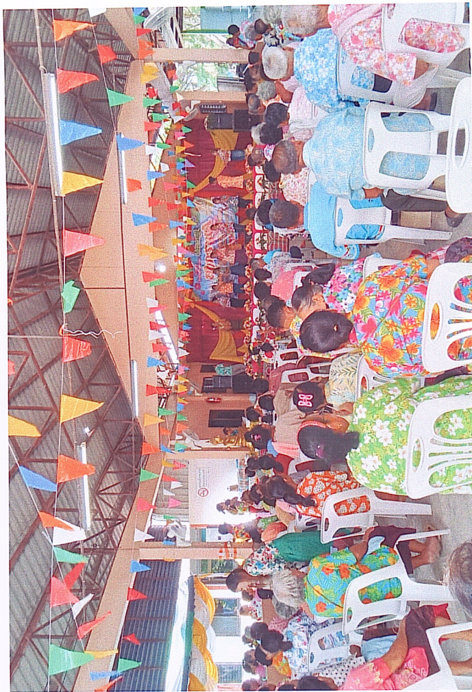
ကမ္ဘာ့အိမ်ထောင်ရေးနေ့အထိမ်းအမှတ်အဖြစ်